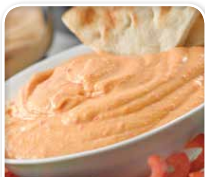
Miksowanie gorących i zimnych składników