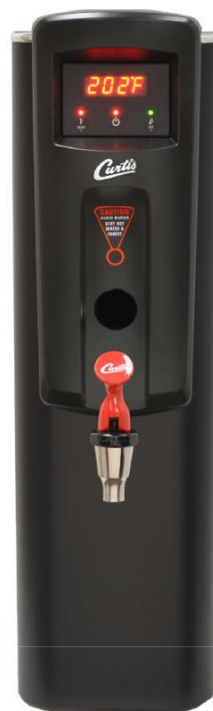
WB5NLB Wysokość zaworu - 35cm

Warnik Curtis z cyfrowym modułem G3 — idealny do przygotowania herbat, zup, produktów liofilizowanych, przydatny również podczas robienia porządków.