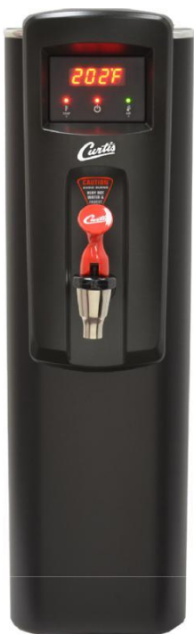
WB5NB Wysokość zaworu - 47cm