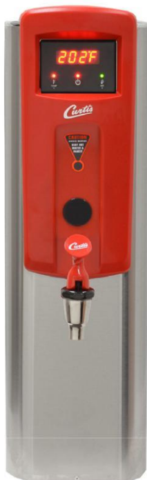
WB5NL Wysokość zaworu- 35cm