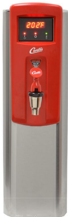
WB5N Wysokość zaworu - 47cm

Wąskie warniki 19-litrowe dostępne w kolorach czarnym i czerwonym z zaworami na wysokości 47 i 35cm.